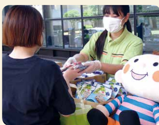
コロナ禍で不安定な生活を送る大学生にも食料品を提供しました

賞味期限がお届け基準以内の商品は、次週以降の企画やインターネット注文「eフレズ」での数量限定企画で活用したほか、お店での販売など、できるだけ食品ロスにならないよう努めました。また各地域のフードバンクなど32団体に寄贈しました。