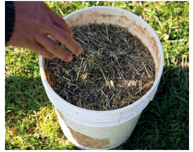
北十勝ファームでは、近隣の耕作放棄地を借り、スタッフが農地を耕してエサとなる作物を育てています