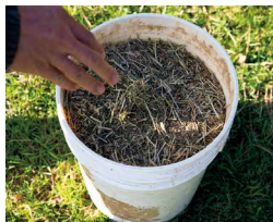
北十勝ファームでは、近隣の耕作放棄地を借り、スタッフが農地を耕してエサとなる作物を育てています