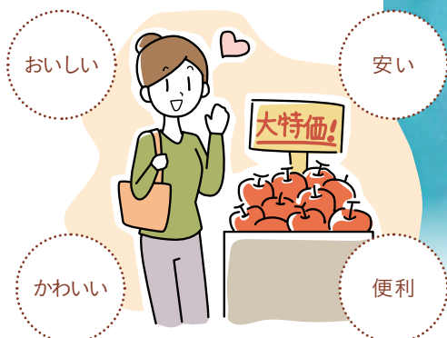
日常のお買い物に 「新しい視点」をプラス！

だからこそ、毎日のお買い物でできることがあります。いつもの「商品の選び方」に、「どこで、誰が作っているか」「どのように届くか」といった視点をプラスして