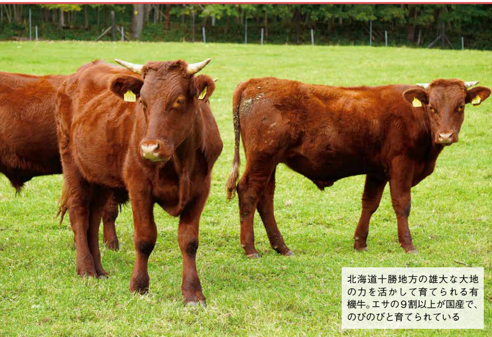
北海道十勝地方の雄大な大地の力を活かして育てられる有機牛。エサの9割以上が国産で、のびのびと育てられている