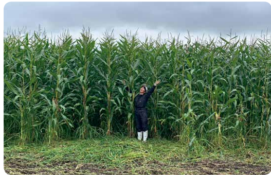
有機牛のエサとなる有機JAS認証取得トモロコシ。総面積11haで、牛の管理と併行して育てている

北十勝ファームで飼育しているのは「日本短角種」という和牛。和牛と言くと黒毛和牛を思い浮かべますが、黒毛和牛はサシと呼ばれる脂が入っていることが価値とされ、輸入穀物中心のエサを与えあまり運動させずに育てます。一方、日本短角種は牧草だけでもよ