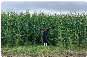
有機牛のエサとなる有機JAS認証取得トウモロコシ。秘面積11haで、牛の管理と併行して育てている

牧草だけでなく育つ日本短角種ですが、北十勝ファームでは穀物も与え、よりおいしいお肉を目指しています。近隣の耕作放棄地を借り、自ら農地を耕してエサとなる作物を育てることで、地元十勝産とあわせ90%以上が国産と高水準の自給率を達成。輸送距離が短く、トータルで排出するCO 2 が少なくなる、エコな畜産業を実践しています。