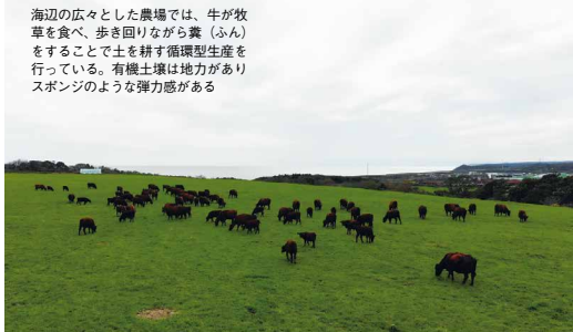
海辺の広々とした農場では、牛が牧草を食べ、歩き回りながら糞（ふん）をすることで土を耕す循環型生産を行っている。有機土壌は地力がありスポンジのような弾力感がある