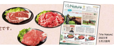
[Vie Nature] 2023年3月2日号