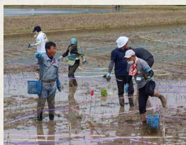
今年5月に行われた田植え交流の様子。組合員やその子どもと一緒に、さまざまな品種の稲を植える「田んぼアート」や生きもの調査を行った

非常に良い取り組みだと思います。1週間に1杯だけでなく、できれば1日にもう1杯食べてほしいですね(笑)。そうすれば需給調整も少なくなります。食料自給率も上がると思いますが、いきなりそこまで無理なので、1週間に1杯、2杯、お米やお米を原料としたものを食べてもらえればと思います。ただ食べるだけではなく、日本や地域の環境が守られていくことも考えてほしいですね。 これからも、佐渡では生きもの、トキ、人、地球環境という視点で米づくりを続けていきます。皆さんとの交流も続けていきたいと思っていますので、ぜひ一緒に歩いていただけたらうれしいです。