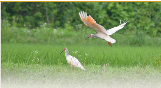
田んぼの中を舞い、エサのドジョウやカエルをついばむトキ。2023年時点で野生下のトキは500羽を超えた

佐渡ではトキと共生する「生きものを育む農法」を続けています。始めた当初と比べ何が変わりましたか。 一番の成果はトキが増えたことです。それは生きものが田んぼに生息しているからこそ。農薬を減らしたため、カメムシなど米の害虫は当然います。トキの放鳥前、農家はお米と害虫しか見ていませんでした。でも今の佐渡の農家は、害虫も当然見ますが、それ食べているクモなどの益虫、トンボやカエルも含めた生きものがいるかを確認しています。農薬を減らしても、昔に比べて害虫の被害は減っています。生態系のバランスが保たれ、益虫が害虫を食べるから、その分農薬を減らせるのです。佐渡にはいろいろな生きものが多い。田んぼはお米だけではなく、生きものも、そして風景も育てている、という感覚があります。