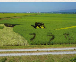
2023年の田んぼアート。今年のテーマは東京都在住の小学生が考案した「わたしたちと田んぼのつながり」