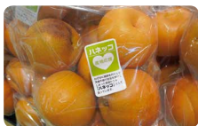
コープデリのお店では、傷やサイズ違いの果物を「ハネッコ」として取り扱っています

ちょっとした傷やサイズ違い、天候被害を受けた野菜や果物は、販売されることなく捨てられることがあります。こうした農産物を「ハネッコ」「不揃い」「天候被害果」として、ちょっとお得な価格で販売することで、できるだけ廃棄する農産物を減らしています。