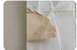
間の紙が茶色いもの