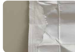
間の紙が白いもの