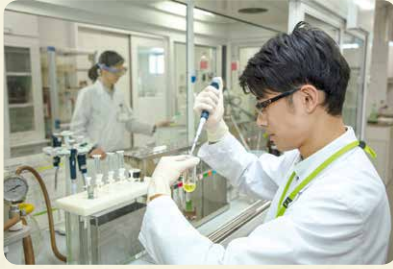
商品検査センターは、フードチェーン全体での食の安全の取り組みが機能していることを、科学的・客観的に確認しています