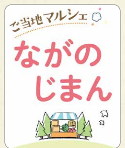
「ご当地マルシェ」ロゴ。各生協ごとに異なります

コープデリ連合会は、今後も会員生協の組合員の皆さまのくらしに貢献できるよう、 事業と活動に取り組みます 。1都7県のコープが手を取りあって、 今までできなかったことも、共同の力で実現 していきます。 設立30周年にあわせて、 今後キャンペーンを行う予定 です。お楽しみに！