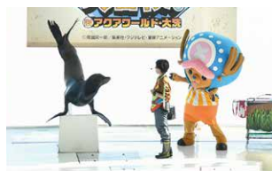
チョッパーのオーシャンライブ ～BIG WASH島の元気を取り戻せ!～

大人気アニメ『ワンピース』とタッグを組んだ期間限定イベントを開催中! <BIG WASH島>を舞台に、麦わらの一味。が、水族館の生き物たちと繰り広げる、 ここでしかできない大冒険。ご家族みんなで、ぜひお越しください。