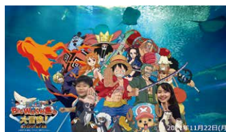
麦わらの一味。になろう! ～ONE PIECE デジタルフォトスポット～