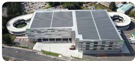
千葉県野田市にある 物流センターの屋上に 設置した太陽光発電パネル

私たちのくらしや社会になくはならない電気。でも電気を作るために多くの二酸化炭素(CO 2 )を排出することは、地球温暖化の原因の1つとされています。コープは発電時のCO 2 排出量が少ない「再生可能エネルギー」の創出・調達に取り組んでいます。