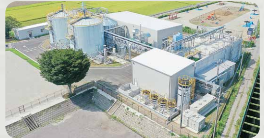
ニューエナジーふじみ野株式会社

食品廃棄物を「ニューエナジーふじみ野株式会社（埼玉県ふじみ野市）」のバイオガス発電所に運びます。食品廃棄物をタンクの中に入れ、微生物の力で発酵。するとメタンを主成分とするバイオガスが発生します。このバイオガスを燃やして発電します。