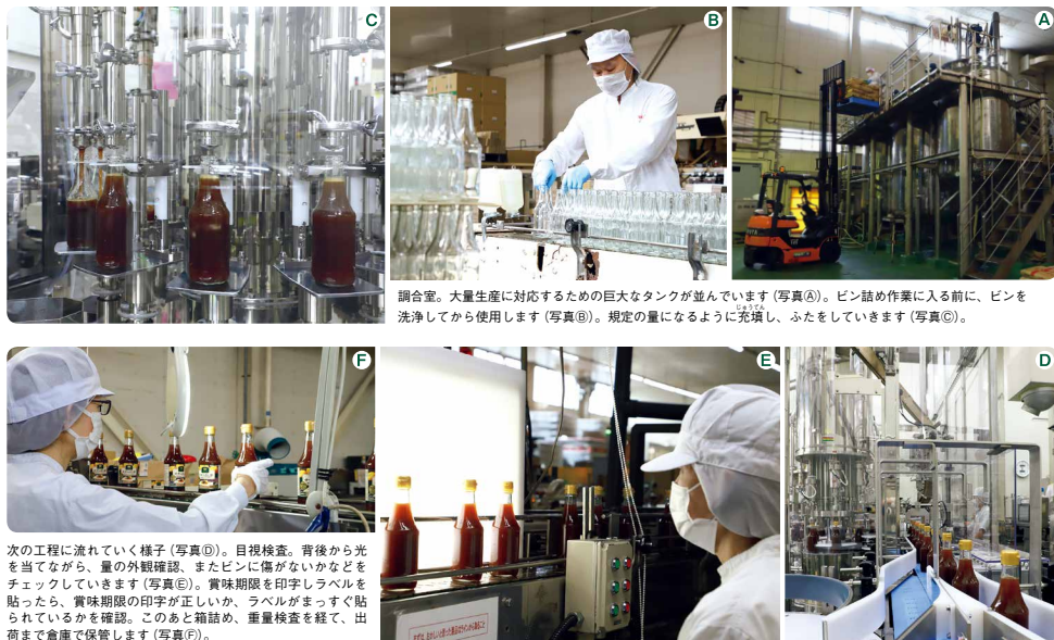
調合室。大量生産に対応するための巨大なタンクが並んでいます(写真A)。ビン詰め作業に入る前に、ビン洗浄してから使用します(写真B)。規定の量になるように充填し、ふたをします(写真C)。