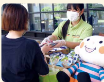
コロナ禍で不安定な生活を送る大学生にも食料品を提供しました