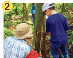
間伐する木の 根元付近の皮をむきます