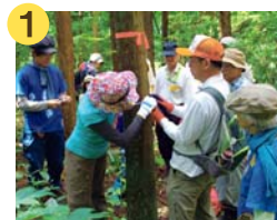
木の直径を測って ゾーニングを決めます

皮むきされた木は1年から1年半かけてゆっくりと水分を抜き、乾燥させてから伐採します。間伐材はリフォーム建材に、端材はアクセサリやコースター、バターナイフなどへ生まれ変わり再利用されます。代表の方からは「コープの環境基金の助成のおかげで森に光を届け、子どもたちに自然の恵みとともに生きていく大切さを教えることが出来ます」と感謝の言葉をいただきました。