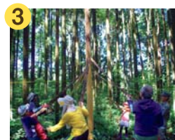
配置についたら準備完了