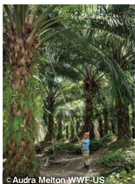
アブラヤシの木。高さは約20m、長いカマで実を切り落とすのは重労働

パーム油は、赤道直下の熱帯で栽培される「アブラヤシ」という植物の実を搾って作られます。その特徴は、生産性が高く幅広い用途に使用できること。私たちの生活に欠かせない商品に使われているため、世界中でパーム油の需要が伸び続けています。生産しているのは主にインドネシアとマレーシアで、この2カ国で世界の生産量の85%を占めています。