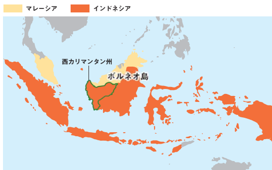
世界の生産量の85%がインドネシア・マレーシアで生産されている