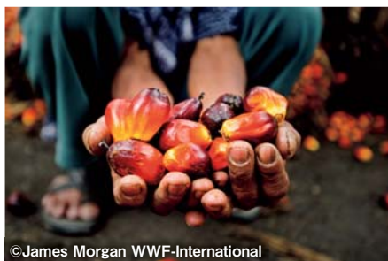
アブラヤシの実。果肉と種子それぞれから油が取れる