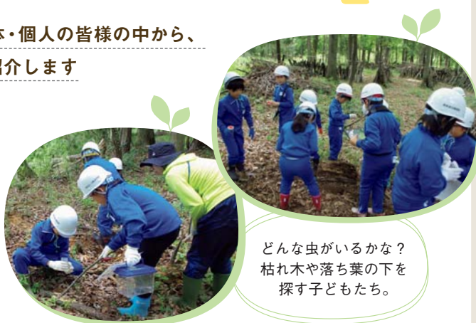
どんな虫がいるかな？ 枯れ木や落ち葉の下を 探す子どもたち。

いばらきコープ環境基金について「地域の方々の協力とコープの環境基金の助成のお陰で子どもたちに自然豊かな里山の体験をさせることができます」とのお言葉をいただきました。