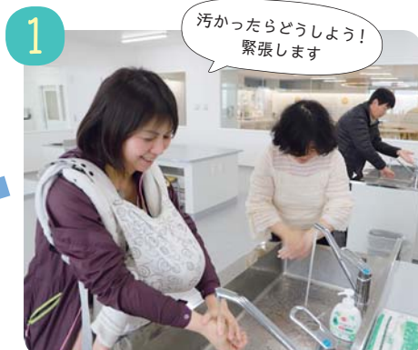
汚れに見立てた専用のローションを手に塗ってから、普段と同じように手を洗います。