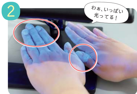
専用のライトを当てて確認。洗い残しの部分が白く光ります。特に爪の周り、関節のしわの部分が多く光っていました。