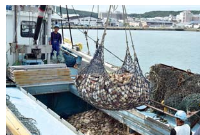
ほたての水揚げの様子