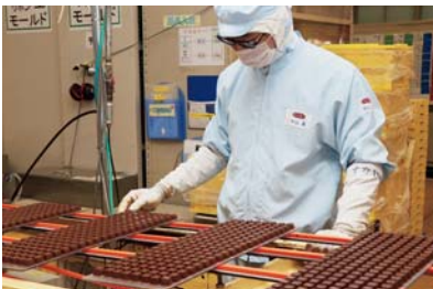
欠けなどがいないかを検品しています