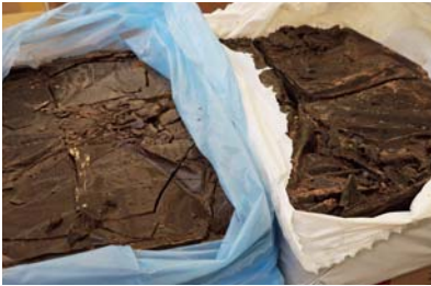
原材料のカカオマス。これを溶かすところからチョコレート作りは始まります

それを練り上げる精練工程では、専用の機械で数時間かけて行います。微妙な温度調節をしながら練ることで、カカオの良