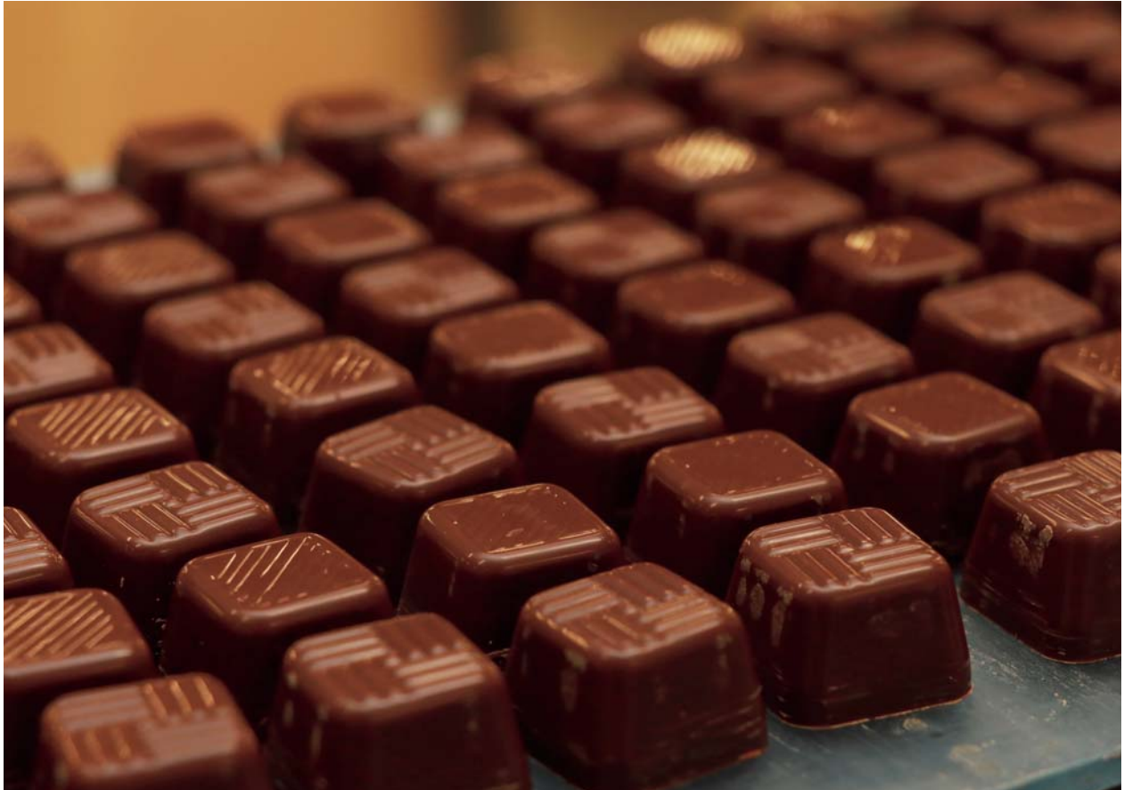
完成したばかりのファミリーチョコレート

組合員の皆さんの声から誕生した「CO・OPファミリーチョコレート」。 マイルドなミルクの風味となめらかな口どけで、愛され続けています。