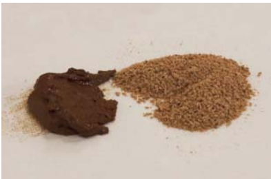
左が微粒化前のざらざらした状態 右は微粒化後、粉状でさらさらしています