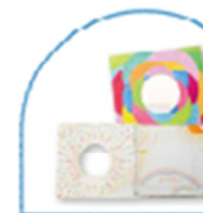
はじめてアルバム

赤ちゃんの初めてをさまざまな企業からの素敵な贈り物を入れてお贈りします。茨城県の自然や文化などの魅力が詰まった飾り箱は、赤ちゃんの大切な思い出の品を保管していただければ、オリジナルのタイムカプセルになります。