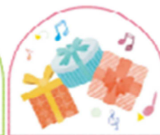
協賛企業・団体からの プレゼント