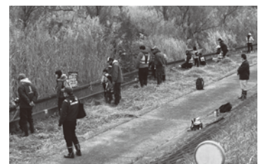
NPO法人 水辺基盤協会 (清掃活動・魚釣り大会)

環境基金事務局 いばらきコープ生活協同組合 総合企画室 〒319-0102 茨城県小美玉市西郷地1703 ☎ 0120-160-231