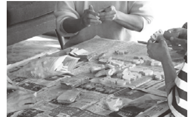
もりとわ (間伐材で積み木制作)