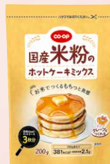
CO-OP 国産米粉の ホットケーキミックス 1個