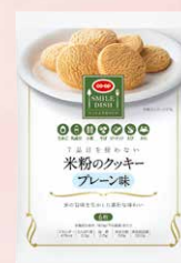
CO-OP 7品目を使わない 米粉のクッキー プレーン味 1個

※「ワン・モア・ライス」やってみた宣言」や「ワン・モア・ライス」アイデア」は何回でも投稿していただけますが、プレゼントの応募は期間中1人1口とさせていただきます。なお、プレゼント企画の対象は組合員とさせていただきます ※賞品の発送は11月中旬を予定しています。厳正な抽選により当選者を決定し、賞品の発送をもって発表にかえさせていただきます。 なお、抽選方法や当選についてのお問い合わせは受け付けておりません