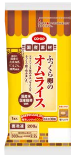
CO-OP ふっくら卵のオムライス

ふっくら焼き上げた卵シートでチキンライスを包みました。チキンライスは国産のたまねぎ、鶏肉、にんじんの具材入りです。