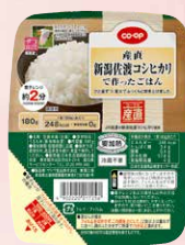
CO-OP 産直 新潟佐渡 コシヒカリで作ったごはん 1個