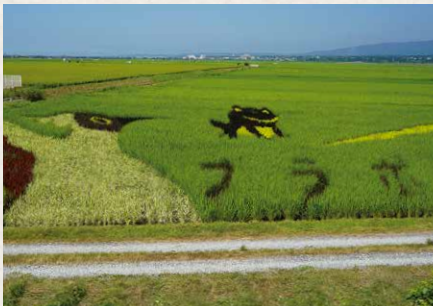
2023年の田んぼアート。 今年のテーマは東京都在住の小学生が考案した「わたしたちと田んぼのつながり」