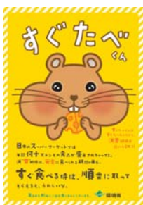
店舗に掲示したポスター

食品スーパーでは消費期限・賞味期限の短い順に食品を手前から陳列しています。コープでは、9〜10月に店頭や売場に環境省のポスターなどを掲示し、手前から順に手にとっていただくようお願いかけました。