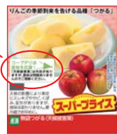
宅配カタログ誌面

コープデリは産地を応援！「天候被害果」は外見が劣りますが、食味は問題ありませんのでご理解ください。