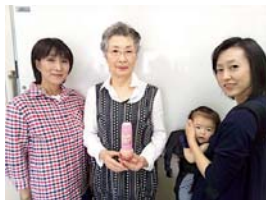
中部ブロック 水戸南コープ会

ピンク色は驚きです。ドレッシングは酸味があり、野菜にかけるとピンク色が華やかです。