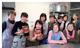
中部ブロック 赤塚コープ会