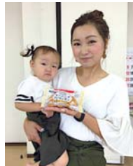
千代川きららコープ会 西部ブロック