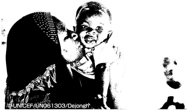
コートジボワール西部にあるソコウラ村の親子

コープみらいは、世界中の子どもたちが十分なケアを受け、よりよい人生のスタートが されるよう、「ユニセフ一般募金」に通年で取り組んでいます。この時期、世界の子ども たちへのお年玉として「ユニセフお年玉募金」を呼びかけています。2016年度のお年玉募 金総額は1,214万9,507円でした。ご協力ありがとうございました。